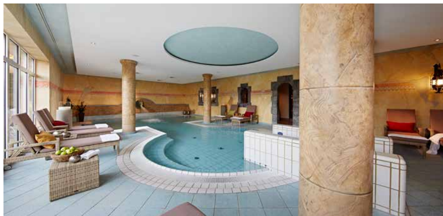
► NA DE GOLF ZIJN ER IN HET LINDNER HOTEL WIESENSEE GENOEG MOGELIJKHEDEN OM TE ONTSPANNEN.

Dit golfhotel ligt namelijk midden in de Taunus, een bosrijk middelgebergte in de Duitse deelstaat Hessen, ongeveer