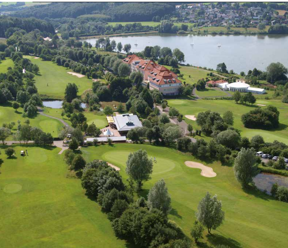
► DE GEVARIEERDE PARK/BOSBAAN VAN WIESENSEE IS GOED VOOR TWEE SPECTACULAIRE RONDEN GOLF.

halverwege Koblenz en Frankfurt am Main. De historie van het oude landgoed gaat terug tot 1692. In 1995 werd deze voormalige boerenhoeve overgenomen door de familie Hankammer (eigenaar van de Brita waterfiltratieproducten), verbouwd tot een wellnesshotel en onlangs uitgebreid met een bijzondere golfbaan. Dat had overigens veel voeten in de aarde. Zo ligt het gebied midden in de overblijfselen van de Limes Germanicus, een eeuwenoude Romeinse verdedigingslinie. De overblijfselen mochten bij de bouw uiteraard niet worden aangetast. Leuk detail: het hotel huisvest een klein, maar leerzaam museum en op aanvraag zijn er rondleidingen mogelijk. Verder verbieden lokale wetten dat er in deze omgeving grondwater wordt opgepompt. Baanarchitect Christian Althaus moest zodoende een acht kilometer lange waterleiding laten aanleggen. Uit praktische overwegingen zijn alle vijvers daarom met elkaar verbonden. Ze worden net als de rest van de baan van water voorzien door een irrigatiesysteem, dat wordt aangestuurd vanuit een verzonken bunker naast de zeventiende hole. Hofgut Georgenthal ligt fraai in een klein dal, waardoor het komvormige geheel een compacte indruk maakt en het gevoel geeft van een stadion course. Daarnaast zien we karakteristieken die bij een typische linkscourse horen: veel glooiingen, een taai soort helmgras vlak naast de fairways en een overdaad aan bunkers. In de