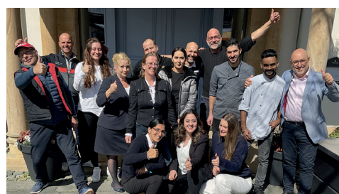
Das ÖKOPROFIT-Team des Hofguts Georgenthal